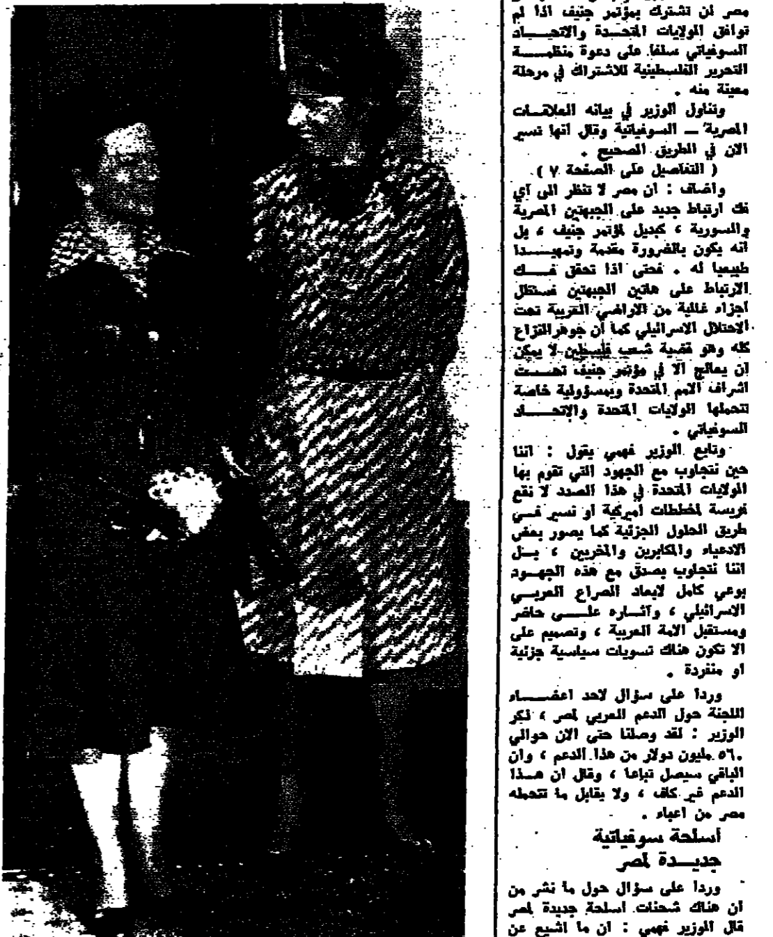
السيدة جهان السادات اشاز زيارتها للسيدة شيل قبيلة مستشار المانيا الغربية في بون امس

يعتبر المسؤولون الالمان زيارته السيدة جهان السادات التي بدأت امس خطوة اولى من اجل علاقات متينة وثيقة مع مصر ، ليس تقتصر علاقات صداقة وجاهلة وتبادل خبرات طبية ، وانما ايضا تبادل علاقات سياسية وثيقة . وذكر هنا انه ينتظر ان يقوم الرئيس السادات بزيارة ألمانيا قريبا تماما كما حصل بالنسبة لفرنسا . في الساعة العاشرة عشرة قيل ظهر امس استقبلت بون سيدة مصر الاولى ، السيدة جهان السادات ويعد الترحيب لمراسم الاستقبال ، استقبلت طائرة « هليكوبتر » التي تصر « جينيش » . وبعد دقائق قليلة من اتلاع ثلاث طائرات « هليكوبتر » ويصحب رداة الطقس وكاتبة الضيف اضطرت للطائرات الى الهبوط قرب المطار ، ومن ثم الانتقال بالمسيرات .